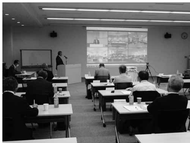
後援会会長連絡会議