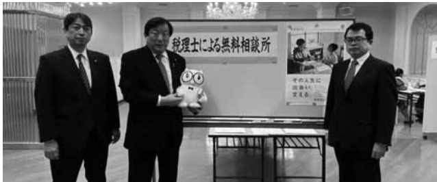
亀岡偉民衆議院議員