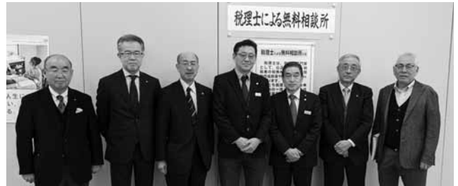
若松謙維参議院議員