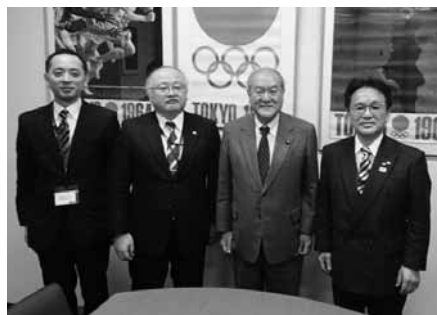
鈴木俊一衆議院議員