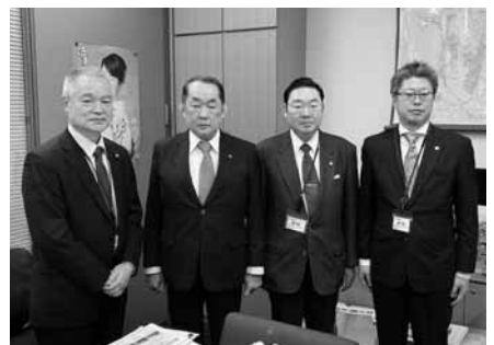
金田勝年衆議院議員