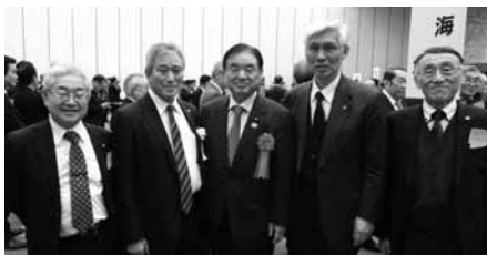
遠藤利明衆議院議員