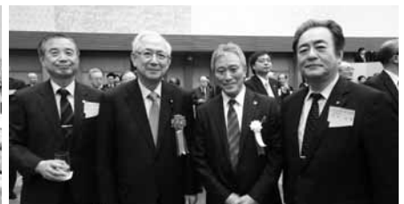
井上義久衆議院議員