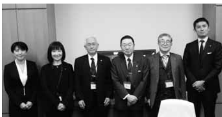
寺田静参議院議員・寺田学衆議院議員