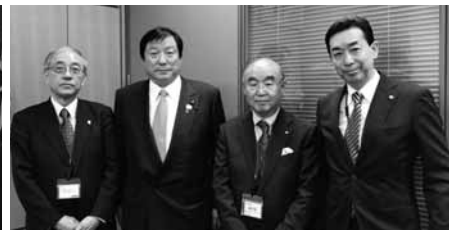
亀岡偉民衆議院議員