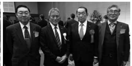
金田勝年衆議院議員