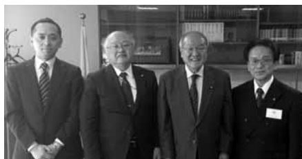
鈴木俊一衆議院議員