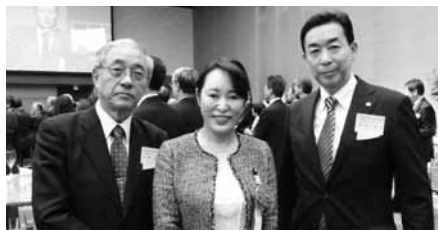
森まさこ参議院議員