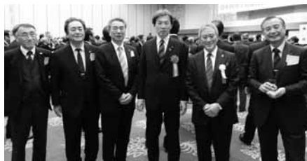
秋葉賢也衆議院議員