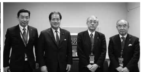
増子輝彦参議院議員