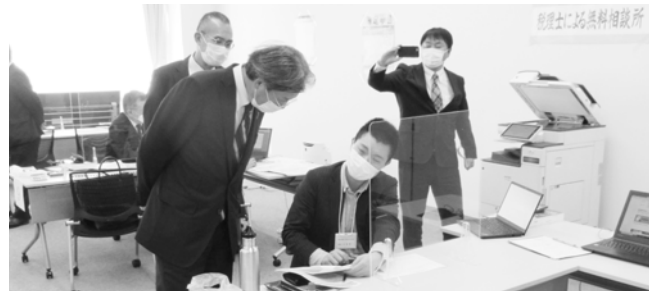
秋葉賢也衆議院議員