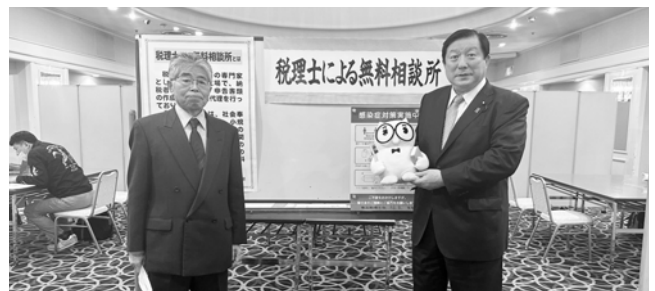
亀岡偉民衆議院議員