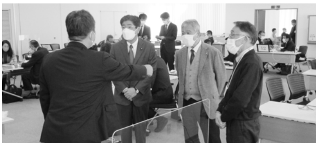
土井亨衆議院議員