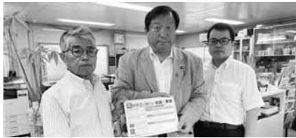
亀岡偉民衆議院議員