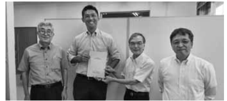
寺田学衆議院議員