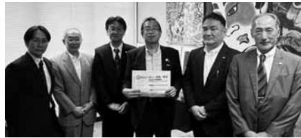
津島淳衆議院議員