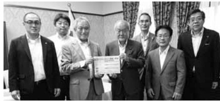
鈴木俊一衆議院議員