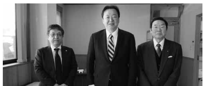
村岡敏英元衆議院議員