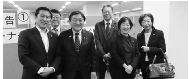
芳賀道也参議院議員 舟山康江参議院議員

2月17日、秋田県税理士会館（秋田市）において、東北税理士会秋田南支部の無料税務相談会が実施され、富樫博之衆議院議員、中泉松司元参議院議員、村岡敏英元衆議院議員が会場視察に訪れ、税政連から鈴木木夫秋田県税政連会長、高橋真一幹事長が対応した。いずれの議員も、会場型の税務支援に興味を示され、今年の申告内容の傾向及び相談内容の状況等についての質問があった。